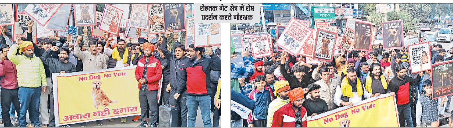
रोहताक गेट क्षेत्र में रोष प्रदर्शन करते गोरक्षक