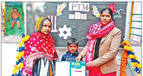
महेंद्रगढ़। विद्यार्थी को सम्मानित करते हुए।