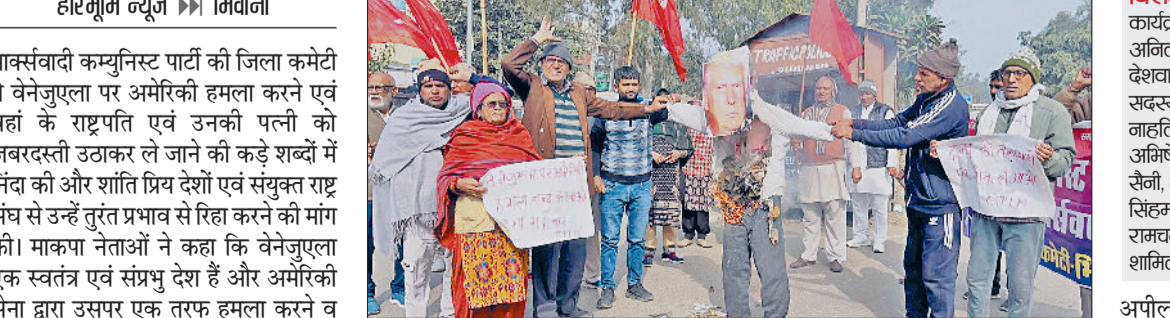
भिवानी। अमेरिकी राष्ट्रपति डोनाल्ड ट्रंप का पुतला फूँकते माकपा नेता एवं कार्यकर्ता।

हरिभूमि न्यूज भिवानी। माक्सवादी कम्युनिस्ट पार्टी की जिला कमेटी ने वेनेजुएला पर अमेरिकी हमला करने एवं वहां के राष्ट्रपति एवं उनकी पत्नी को जबरदस्ती उठाकर ले जाने की कड़े शब्दों में निंदा की और शांति प्रिय देशों एवं संयुक्त राष्ट्र संघ से उन्हें तुरंत प्रभाव से रिहा करने की मांग की। माकपा नेताओं ने कहा कि वेनेजुएला एक स्वतंत्र एवं संप्रभु देश है और अमेरिकी सेना द्वारा उसपर एक तरफ हमला करने व वहां की स्वतंत्र जनता द्वारा चुने हुए राष्ट्रपति निकोलस मादुरो व उसकी पत्नी को शनिवार रात को उनके बैडरूम से अमेरिकी सैनिकों द्वारा जबरदस्ती घसीटकर उतारने की घटना अशोभनीय एवं निंदनीय है। रविवार को