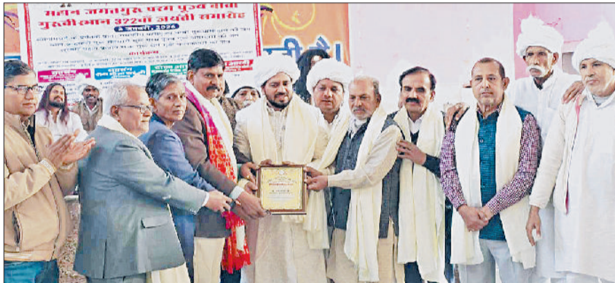
नारनौल। कार्यक्रम में सतनामियों को सम्मानित करते हुए।