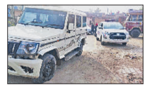
नारनौल। सलामपुरा में बोलेरो के पास खड़ी पुलिस गाड़ी।