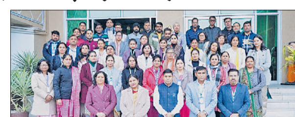
नारनौल। कार्यशाला में भाग लेने वाले शिक्षक।