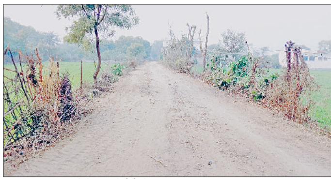
नारनौल। सड़क बनाने के लिए जैसीबी से साफ किया गया रास्ता।