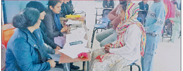
महेंद्रगढ़। सम्मेलन में उपस्थित अभिभावक।